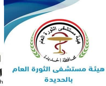
هيئة مستشفى الثورة العام بالحديدة