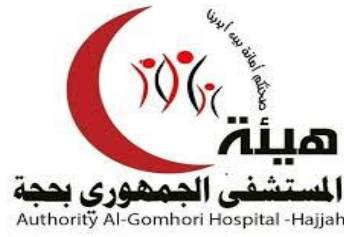
Authority Al-Gomhori Hospital -Hajjah